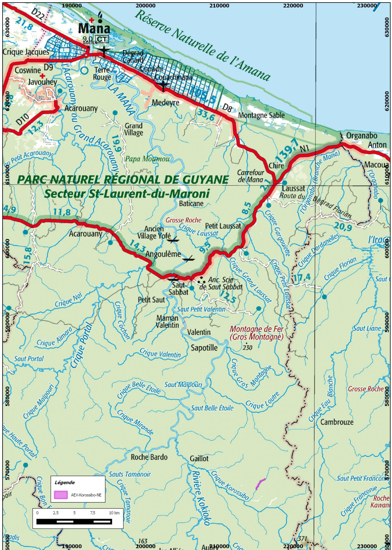
Carte de situation de l'AEX « Korossibo NE » de la SARL CTA sur la commune de Mana sur un fond de carte IGN au 1/250 000° en RGF95 UTM22